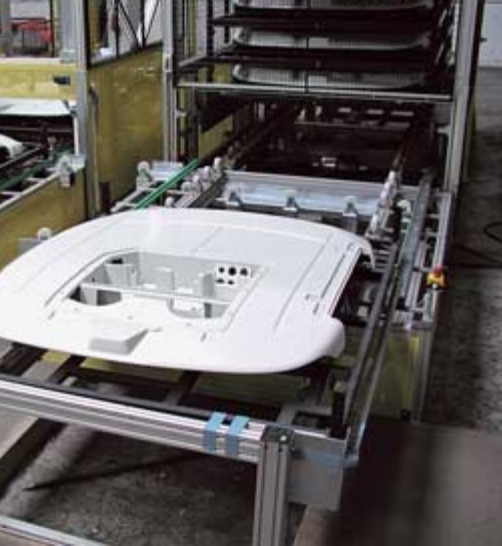
Unmittelbar hinter der Spritzgussmaschine werden die einzelnen Teile des Dachs vormontiert.