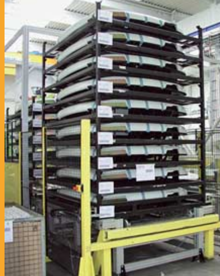
Im Transportgestell warten die vormontierten Kabinendächer auf die Auslieferung.

die Werkzeuge auch regelmäßig penibel gepflegt. Denn eine lange Nutzungsdauer reduziert natürlich die Kosten. Ein weiterer großer Kostenfaktor ist der Energieverbrauch. Denn das Kunststoffgranulat, das in großen Silos lagert, muss bei großer Hitze verflüssigt werden.