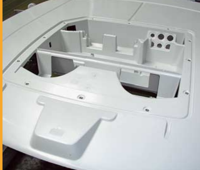
Die Formgebung im Spritzgussverfahren vereinfacht die Montage der Klimaanlage und der anderen Einbauelemente.